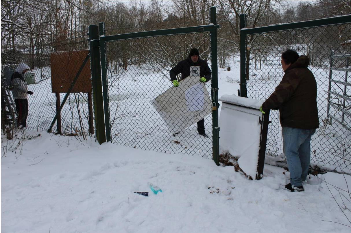
Abb.6: Bei jedem Wetter unterwegs. Eine marode Schautafel um Amphibienbiotop wurde abgebaut. Weitere Tafeln werden regelmäßig gereinigt und mit Wetterschutzlasur überarbeitet

Die Zahl der Teilnehmenden hat sich um 4 Teilnehmer verringert.