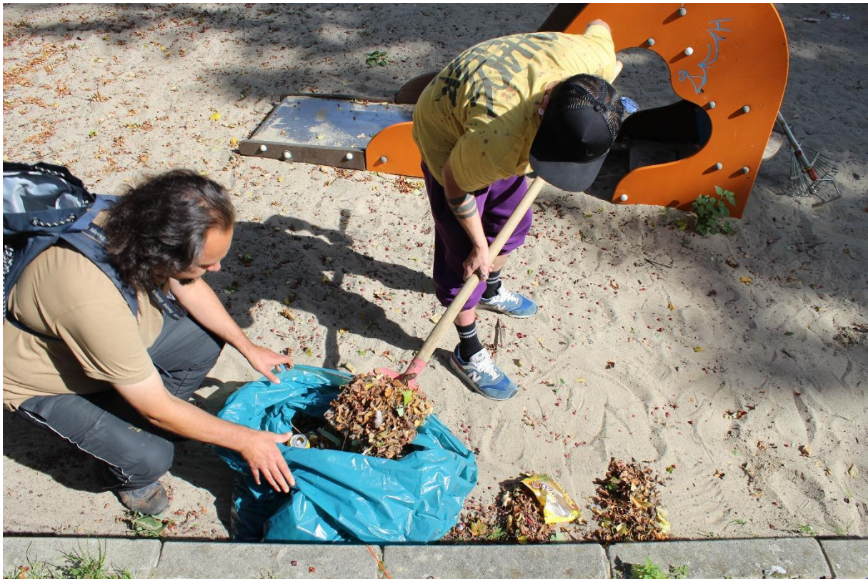
Abb. 4: Die Ergebnisse ihrer Arbeit sind konkret sichtbar

Um diesen Missständen entgegenzuwirken, wurde durch die Drogenhilfe Hildesheim e.V. ein gemeinnütziges Beschäftigungsangebot eingerichtet.