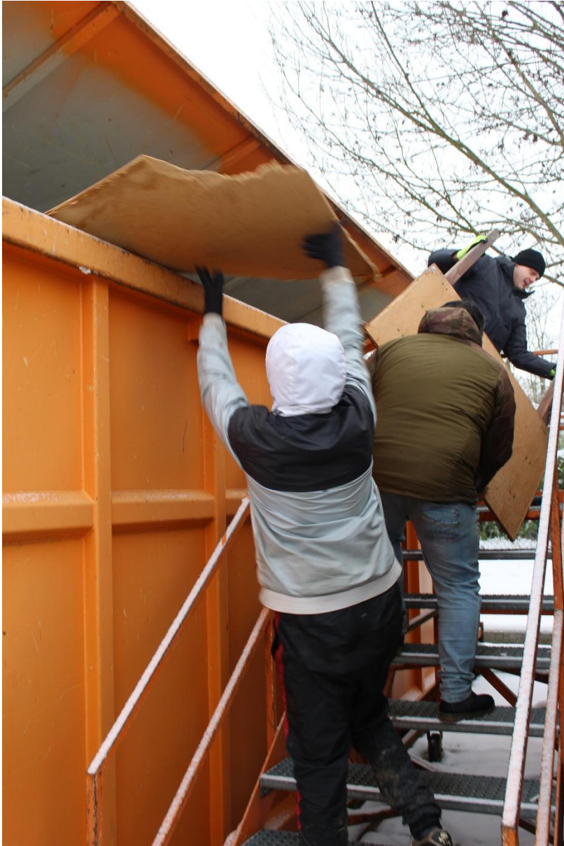
Abb.7: Entsorgung von Sperr- und Sondermüll für Menschen die keine eigene Transportmöglichkeit haben.

Nach jahrelanger Arbeitslosigkeit führte das Beschäftigungsangebot bei einigen Projektteilnehmern zu einer Verbesserung der Lebensverhältnisse. Die Betroffenen erfuhren, dass es sich lohnen kann, einer ehrenamtlichen Tätigkeit nachzugehen, wobei der eigene Arbeitsaufwand angemessen entschädigt wurde.