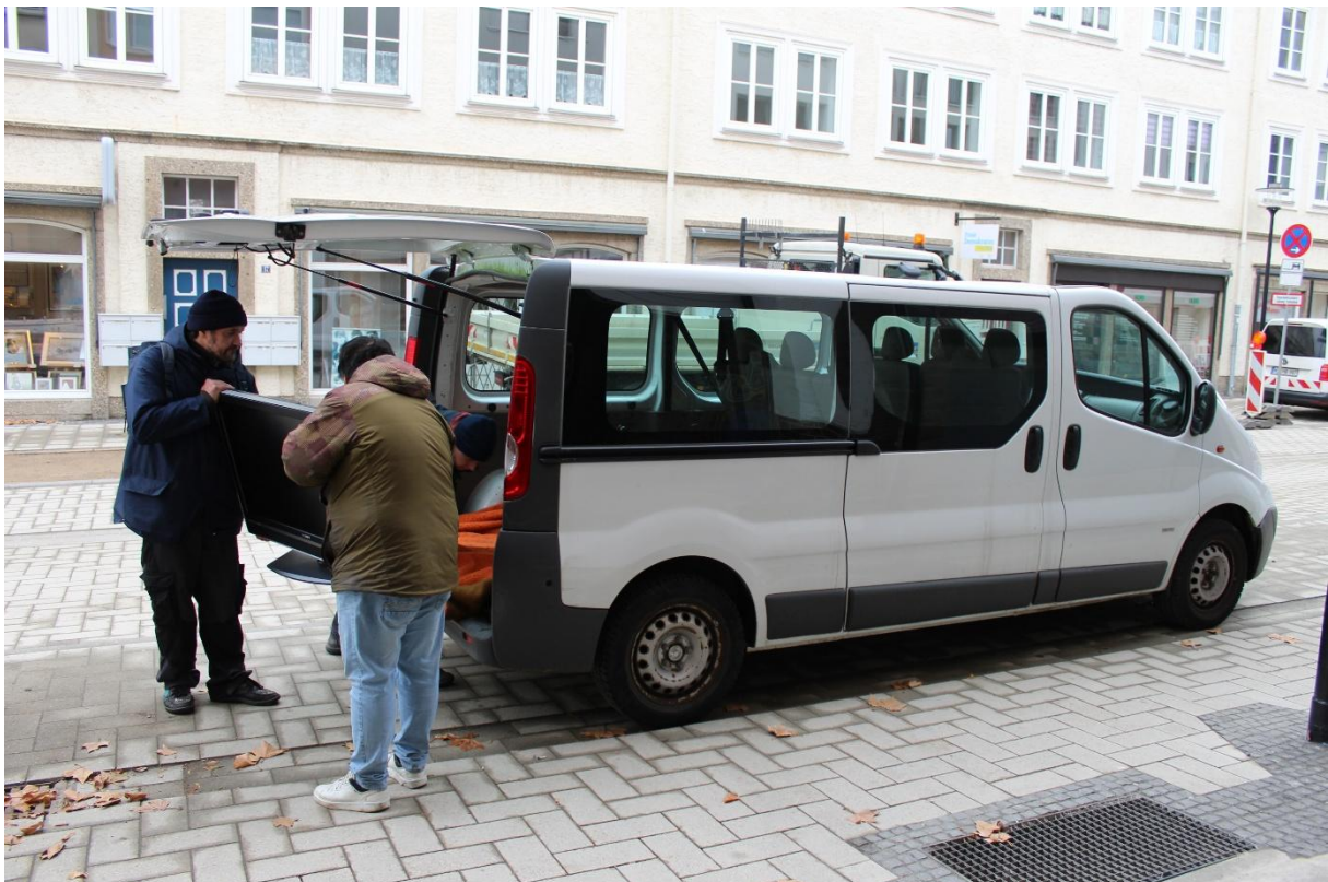
Abb.5: Eine schnelle und unbürokratische Transporthilfe für Menschen mit Behinderungen wurde dankbar angenommen

Einige Menschen der Zielgruppe waren aufgrund psychischer und physischer Einschränkungen nicht in der Lage mitzuwirken und konnten so für dieses Projekt leider nicht erreicht werden.