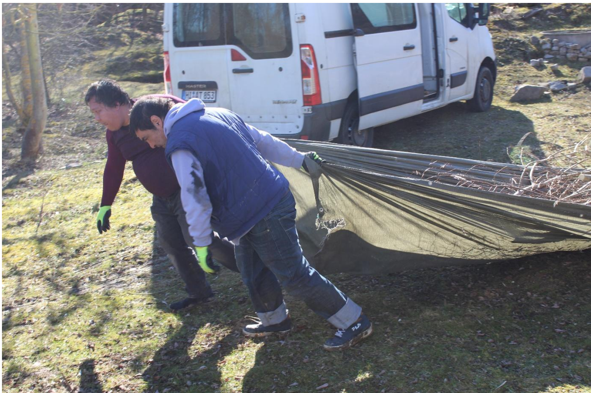
Abb.8: Die betroffenen Menschen brauchen kontinuierliche Angebote, damit sie eine Chance erhalten, wieder in der Gesellschaft Fuß zu fassen.

Mit diesem sozialtherapeutischen Arbeitsansatz wurde die psychische und physische Gesundheit gefördert und die Lebensqualität verbessert. Das psychische Wohlbefinden wurde durch professionelle Förderung des Sozialverhaltens in der Gruppe verstärkt. Ein weiterer therapeutischer Ansatz war das positive Erleben einer sinnstiftenden Beschäftigung ohne Zwangskontext. Mit solchen positiven Auswirkungen auf die Psyche wurde auch eine Möglichkeit von Verhaltensalternativen zum Drogen- und Alkoholmissbrauch mit entsprechenden gesundheitlichen Folgen bereitgestellt.