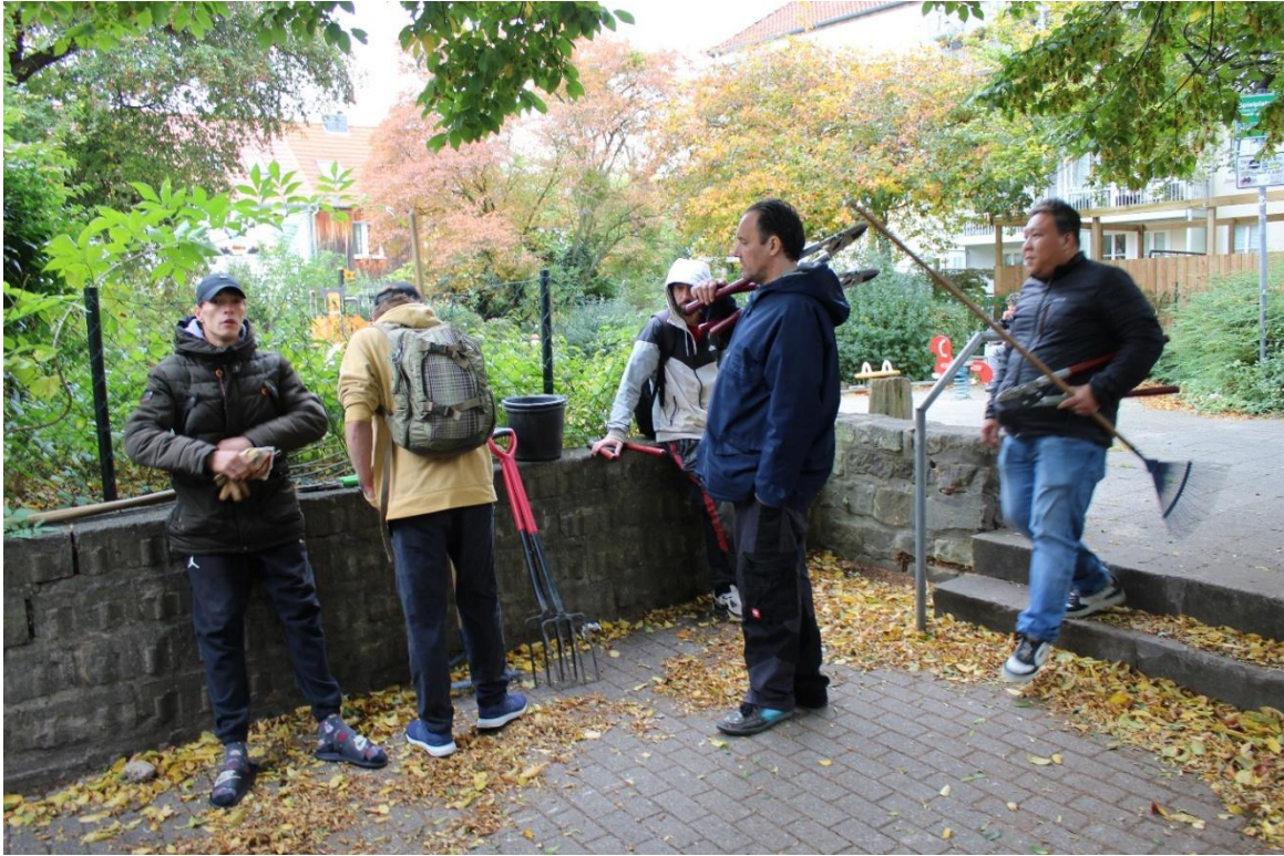
Abb.2: Besprechung vor dem Arbeitseinsatz an einem Hildesheimer Spielplatz