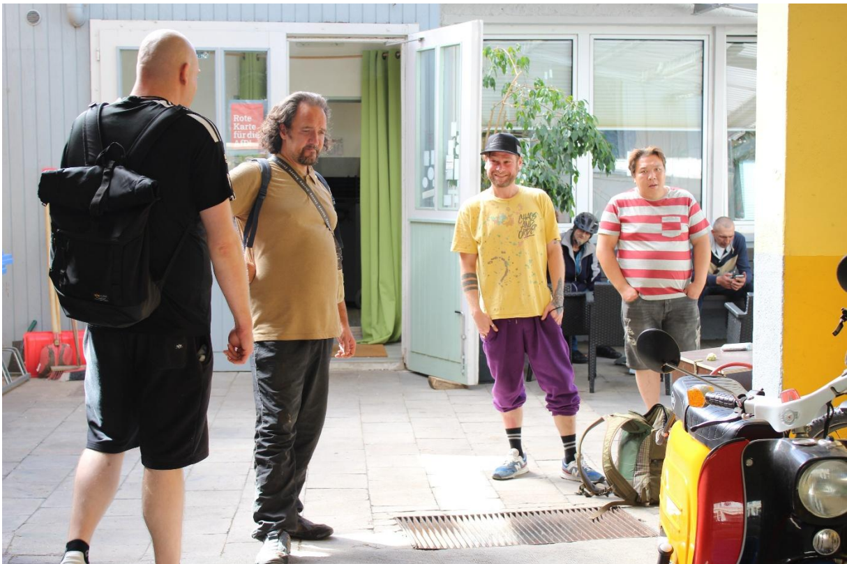
Abb.1: Die ehrenamtlichen Helfer warten auf ihren Arbeitseinsatz.