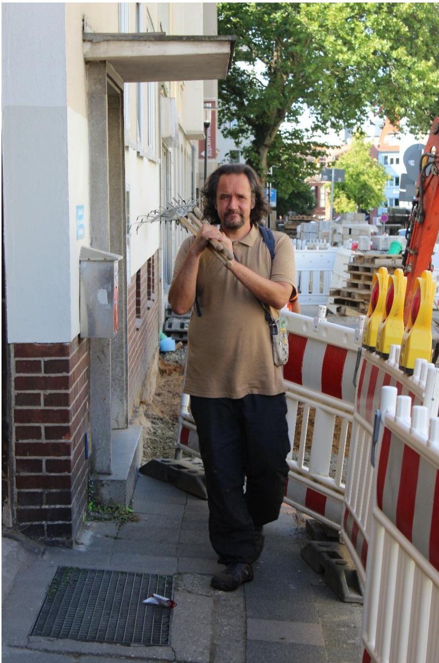
Abb2: Werkzeuge und Geräte werden verladen

Perspektivlosigkeit und der Eindruck im öffentlichen Leben nicht erwünscht zu sein, führte zu Unzufriedenheit und Frustration seitens der Szeneangehörigen.