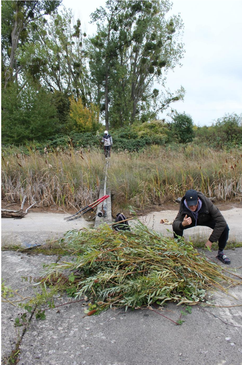
Abb.5: Die aktive Mitgestaltung trägt zur Identifikation mit der Stadt bei. Hier mit den Naturschutzprojekten der Unteren Naturschutzbehörde an der ehemaligen Panzerwaschanlage.